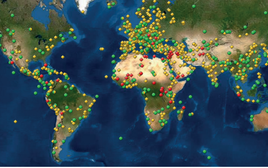
Şekil 1: Dünya Miras Alanları Haritası