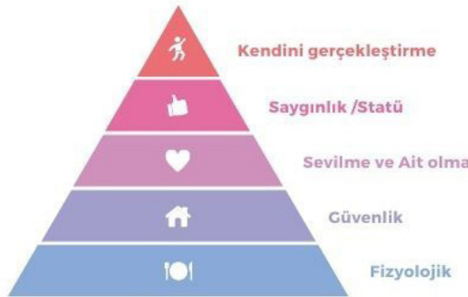
Şekil 1. Maslow'un İhtiyaçlar Hiyerarşisi (Maslow, 1954)

Maslow (1954), insan ihtiyaçlarını ardışık olarak hiyerarşik bir şekilde ortaya koymuştur (Şekil 1). Maslow ihtiyaçlara yönelik olarak; "fizyolojik ihtiyaçlar", "güvenlik ihtiyacı", "sevilme ve ait olma ihtiyacı", "saygınlık/statü ihtiyacı" ve "kendini gerçekleştirme ihtiyacı" düzeylerini sıralamıştır. Buna göre insanların belirli alanlarda yer alan ihtiyaçlarını karşıladıklarında daha üst düzey ihtiyaçlarının ortaya çıktığı öne sürülmektedir.