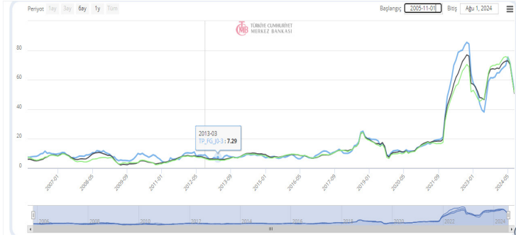
Şekil 1.1. Tüketici Fiyat Endeksi (TÜFE) Yıllık Değişim Oranları