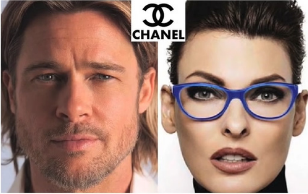
Brad Pitt, Age 49 Chanel No. 5 Ad, 2012

yine toplumsal cinsiyet özelinde düşündüğümüzde fazlasıyla problematiktir.