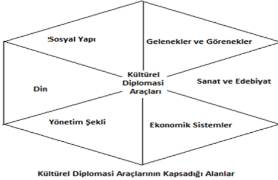
Şekil 1: Kültürel Diplomasinin Araçları 259

Şekil 1’de görüldüğü üzere kültürel diplomasi, küreselleşen dünyada çeşitli enstrümanlarla ortak paylaşım alanı oluşturmuştur. Toplulukları ve doğal olarak ulusları meydana getiren din, sanat, edebiyat, gelenekler, görenekler, sosyal yapı ve yönetim şekli diğer uluslarla paylaşılmaktadır. Bu paylaşımlar sonucunda üretilen çeşitli fikirler, yaşam tarzı, estetik anlayışı ve tatlar kültürel etkiyi artırmaktadır. İfade edilen sanat, edebiyat, gelenek ve görenekler ve yaşam tarzı ülkenin moral değerlerini de yükseltmektedir. Kamu diplomasisine giden başarı yolu, kültürel diplomasiden geçmektedir.